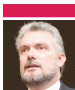
Του Γιώργου Α. Κορομπλά*

Οι «αντικειμενικές» δαπάνες διαβίωσης που μόνο κατ' αντικειμενικό τρόπο δεν προσδιορίζονται, όπως και οι δαπάνες απόκτησης περιουσιακών στοιχείων με τον τρόπο που λειτουργούν σήμερα, ως τρόπος προσδιορισμού του φορολογητέου εισοδήματος, δεν παράγουν ουσιαστικό αποτέλεσμα και κατά συνέπεια δεν καταπολεμούν τη φοροδιαφυγή διότι απλά καλλιεργούν την ψευδαίσθηση ότι φορολογούνται όλα τα εισοδήματα. Γνωρίζουμε πολύ καλά ότι με τα τεκμήρια τιμωρούνται φορολογικά συνήθως χαμηλόμισθοι υπάλληλοι οι οποίοι έχουν την ατυχία να διαθέτουν κάποια περιουσιακά στοιχεία (σπίτι, αυτοκίνητο, σπύτι στο χωριό συνήθως από κληρονομιά) από τα οποία προκύπτει τεκμαρτό εισόδημα μεγαλύτερο από το πραγματικό, ενώ λαμβάνουν συγχωροχάρτι αυτοί που έχουν τη δυνατότητα να αποκρύπτουν τα πραγματικά τους εισοδήματα.