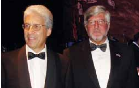
Με τον πρώην πρέσβη της Ελλάδας στη Washington κ. Αλέξανδρο Μαλλιάρη.

Βασικά διαφωνώ με το πρώτο σημείο και συμφωνώ με το δεύτερο, αν και με σημαντικά ελαφρυντικά για τους ιθύ-