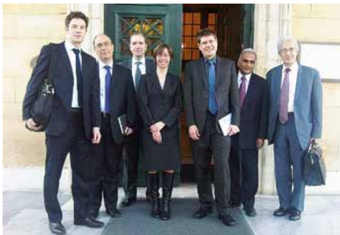
Απρίλιος 2010. Με το κλιμάκιο του ΔΝΤ έξω από τη Βουλή.

μιση των ΔΟΥ και του ΣΔΟΕ. Επίσης, το ΔΝΤ προσέφερε στις ελληνικές ερχές την εγκατάσταση στην Αθήνα ενός διεθνούς εμπειρογνώμονα σε φοροτεχνικά θέματα (χωρίς οικονομική επιβάρυνση για την κυβέρνηση), για την παροχή άμεσης τεχνικής βοήθειας σε καθημερινή βάση. Αν οι πληροφορίες μου είναι ορθές, το πρόσωπο έχει επιλεγεί και θα αναλάβει τα καθήκοντά του το Φεβρουάριο.