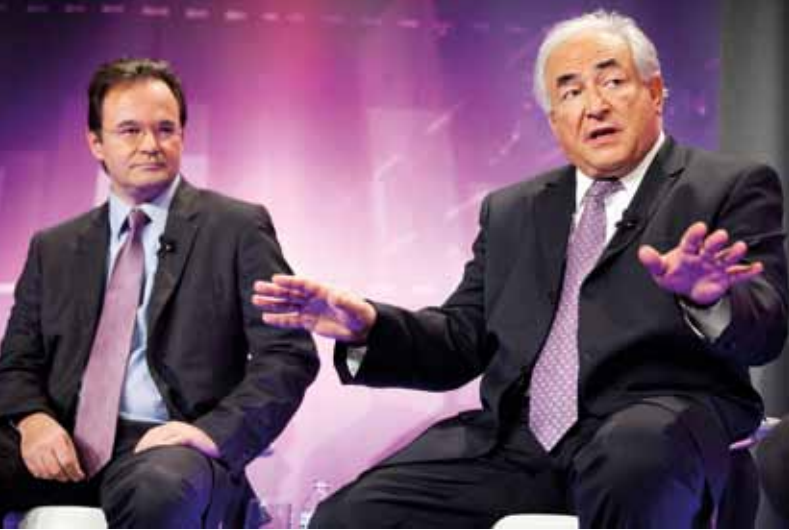
Ο Υπουργός Οικονομικών Γιώργος Παπακωνσταντίνου '80 και ο Γενικός Διευθυντής του ΔΝΤ κ. Dominiq Strauss-Kahn σε κοινή συνέντευξή τους στο BBC.

Πρωθυπουργούς ή Προέδρους Δημοκρατίας των νεοσύστατων αυτών κρατών.