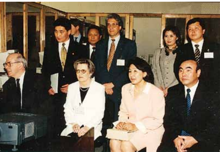
1988. Με τον τότε Γενικό Διευθυντή του ΔΝΤ κ. Camdessus και τον Πρόεδρο της Δημοκρατίας του Kyrgyz, κ. Aliev.