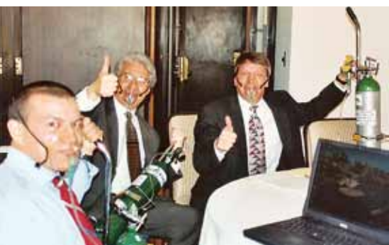
Επικεφαλής της αποστολής του ΔΝΤ στη La Paz, πρωτεύουσα της Βολιβίας. Λόγω του υψόμετρου (~4.100 μέτρα), φορούν μάσκες οξυγόνου μέχρι να συνηθίσει ο οργανισμός!

τις του ΔΝΤ σ' αυτόν τον τομέα, έχει γίνει κάποια πρόοδος, αλλά δεν μπορώ να μιλήσω με βεβαιότητα.