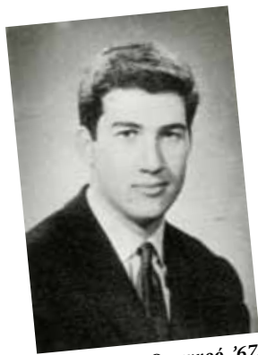
Από το Θησαυρό '67.

Από το ρευπίον των 40 χρόνων της τάξης του '67 το 2007.