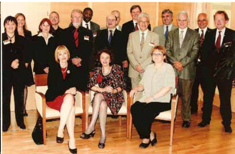
2007. Με υψηλόβαθμα κυβερνητικά στελέχη της Σλοβενίας.

Συνοπτικά, πώς θα μπορούσατε να χαρακτηρίσετε την αποστολή σας τον περασμένο Απρίλιο, που, αν δεν κάνω λάθος, ήταν η πρώτη και τελευταία φορά που ασχολήθηκαν επαγγελματικά με την Ελλάδα ως στέλεχος του ΔΝΤ;