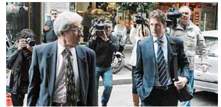
Απρίλιος 2010. Έξω από το Υπουργείο Οικονομικών υπό το «βλέμμα» των ΜΜΕ.

Από πλευράς εσόδων, οι διαπιστώσεις ήταν ήδη γνωστές: υστέρηση στην είσπραξη εσόδων, ασθενείς φοροεισπρακτικοί μηχανισμοί, παρατεταμένες και περίπλοκες διαδικασίες των φορολογικών δικαστηρίων. Αλλά το νούμερο που μας έκανε τη μεγαλύτερη εντύπωση (μας