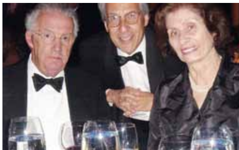
Με την ελληνική καταγωγής γ. Γερουσιαστή της πολιτείας του Maryland κ. Paul Sarbanes.

νοντες: Πρώτον, μία κυβέρνηση που αναλαμβάνει την εξουσία μετά από πέντε χρόνια στην αντιπολίτευση χρειάζεται λίγο χρόνο για να αξιολογήσει την κατάσταση και να αποφασίσει τι μέτρα πρέπει να πάρει, με τι ρυθμό και με ποια ιεράρχηση των προτεραιοτήτων. Επιπλέον, τα επίσημα στοιχεία που παρείχε μέχρι τότε η προηγούμενη κυβέρνηση στην ΕΕ αποδείχθηκαν τελικά αναξιόπιστα. Έχει λεχθεί ότι η Τράπεζα της Ελλάδος είχε δημοσιεύσει στοιχεία που ήταν πλησιέστερα στην πραγματική εικόνα, καθώς επίσης έχει ακουστεί ότι η ΕΚΤ είχε ενημερώσει τον Πρωθυπουργό αμέσως μετά την ανάληψη της εξουσίας από την παράταξή του. Δεν έχω προσωπική γνώση αυτών των θεμάτων, που έχουν πολιτικές διαστά-